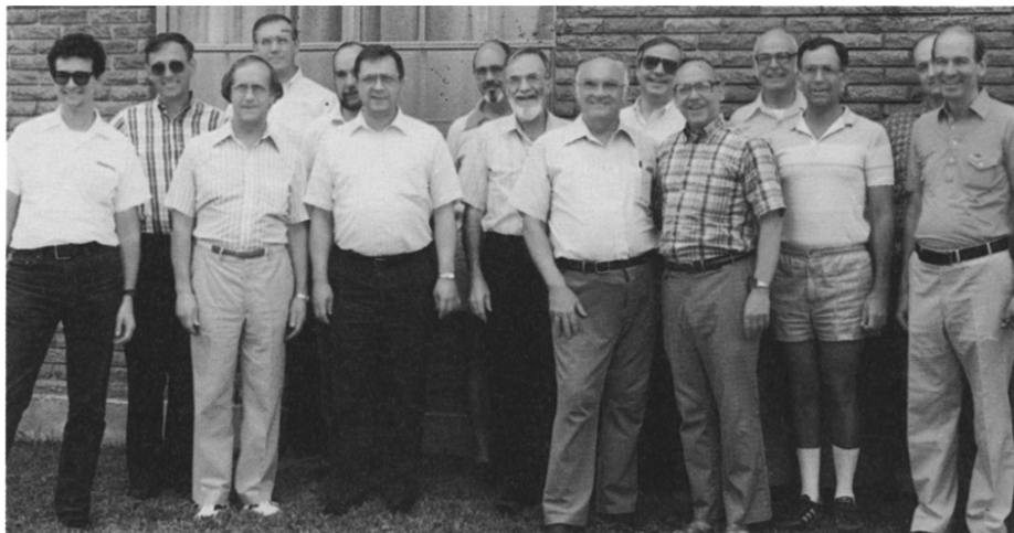
... et en 1987.