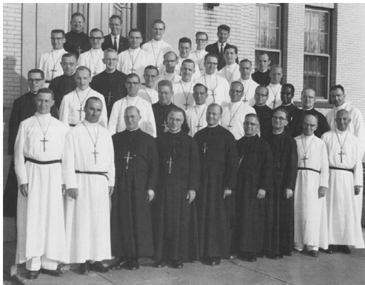
Les Frères du Sacré-Cœur et leurs missionnaires avant 1960...