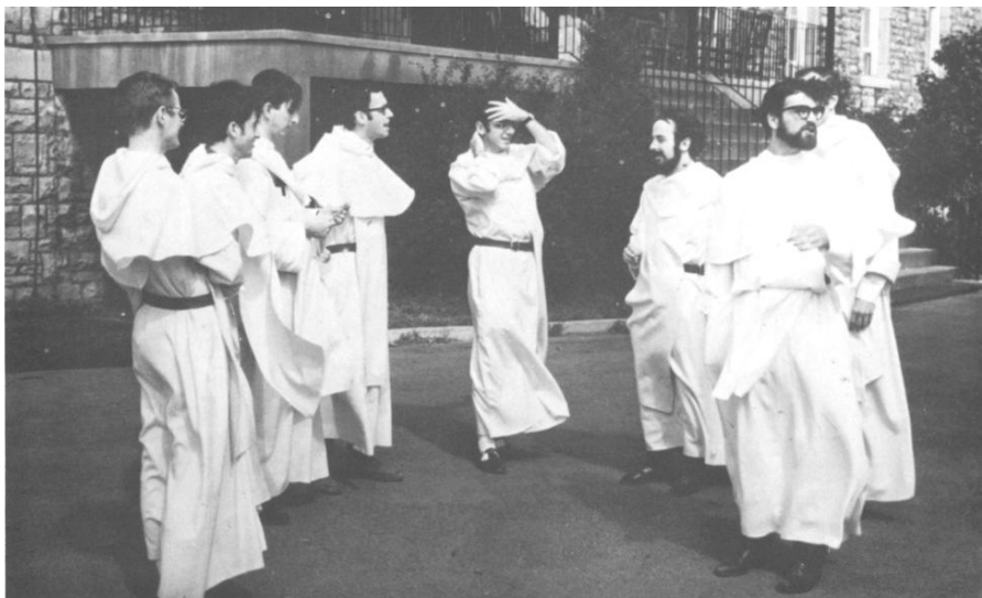
1970 : des jeunes séminaristes dominicains "dans le vent" !

« Par ce Décret, "le Concile se propose de traiter de la vie et de la discipline des instituts religieux et de pourvoir à leurs besoins, selon les exigences de l'époque actuelle" ». La sainteté consistait à tourner le dos au monde pour aller à Dieu. La perfection postconciliaire sera d'être tout à la fois tournée vers Dieu et vers le monde. « Voici le théorème de