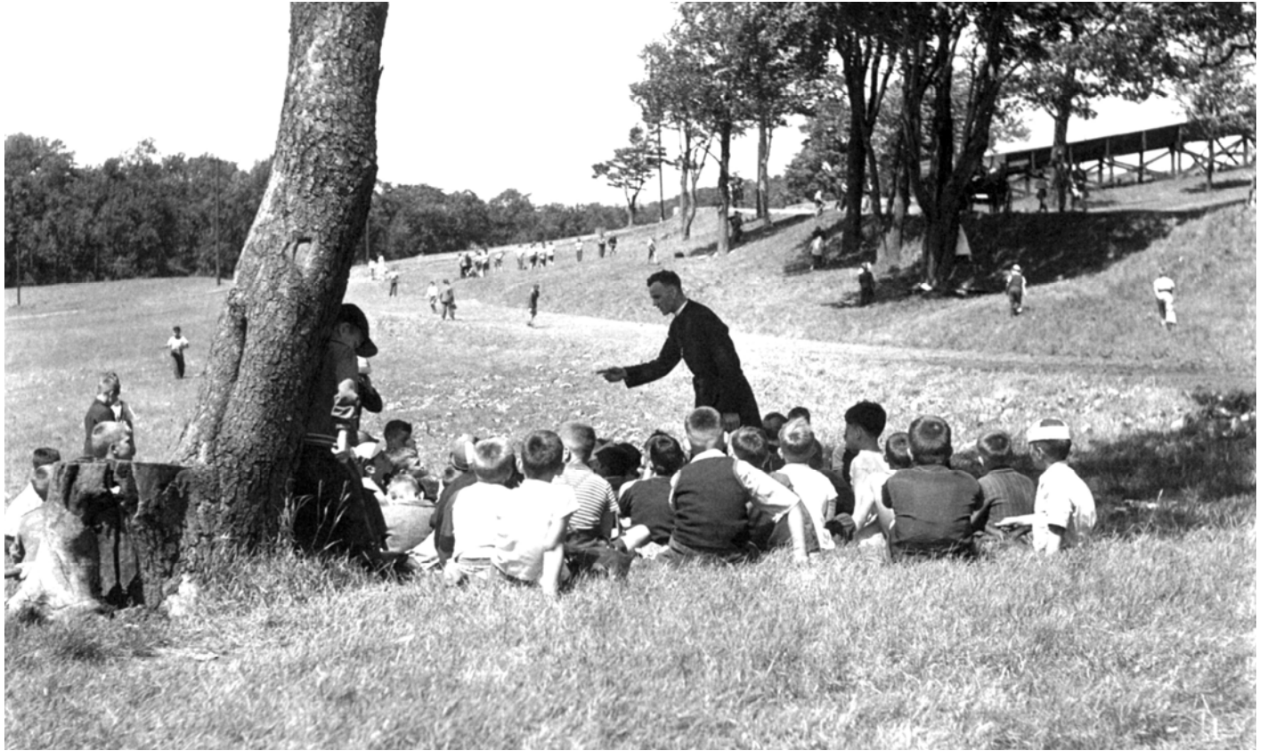
Un prêtre enseignant donnant ses explications en plein air en 1950.

étaient des témoins. Ce sont eux surtout qui ont exercé l'attraction. Il y a un mot de Bergson, dans Les deux sources : « les saints ne demandent rien, ils n'exigent rien, pourtant, ils obtiennent tout ; ils ne parlent pas, il leur suffit d'exister, leur existence est un appel, une attraction, une séduction. » C'est cela que j'ai vécu, j'ai rencontré des hommes donnés à Dieu dans la gratitude la plus totale. C'était, aussi, peu après la béatification des saints Martyrs canadiens. »