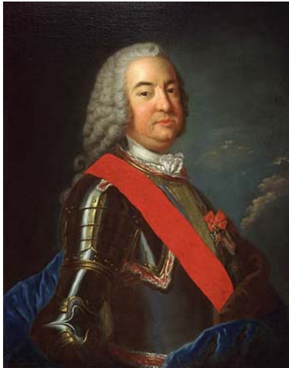
Pierre Rigaud, marquis de Vaudreuil

preuve, le Canada français retrouva la protection divine. Quoi qu'en dise "l'école de Montréal", la politique d'assimilation décidée à Londres échoua une première fois lorsque la Couronne anglaise finit par reconnaître les privilèges de l'Église catholique dans sa colonie américaine !