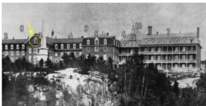
Les agrandissements successifs de l'hôpital de Chicoutimi. On remarque au fronton (n° 3) la statue de saint Antoine.

Aussitôt, les faveurs de saint Antoine abondent au point qu'en une année, l'hôpital peut s'agrandir d'un... orphelinat. Bientôt, toujours avec la même source de financement, on construira le monastère des religieuses, puis on agrandira l'orphelinat, et enfin l'hôpital. C'est ainsi que le très modeste et précaire "hôpital des matelots" de Chicoutimi devint l'hôpital St-Vallier.