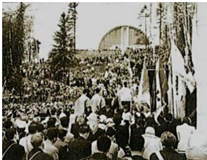
La foule des pèlerins en 1952 ; au fond, la verrière de la nouvelle chapelle mariale

Le 21 avril suivant, l'abbé DeLamarre s'éteignait paisiblement en invoquant saint Antoine et Notre-Dame de Lourdes, quelques heures après avoir été victime d'une