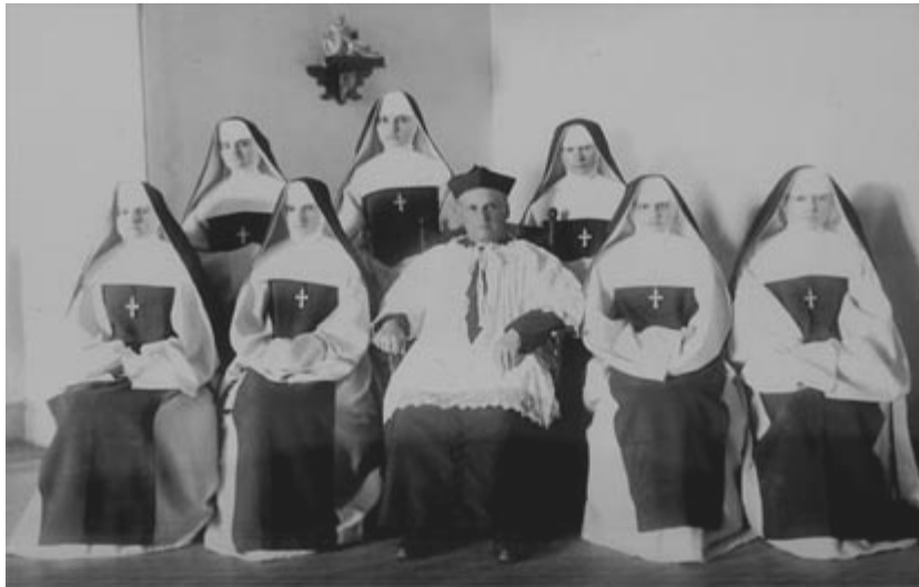
L'abbé DeLamarre et les sept fondatrices des sœurs Antoniennes

bougeries qu'on appelle la guerre ». Nombre de ses réflexions restent d'actualité, par exemple : « Le mal n'est pas dans le progrès même. Il est dans ceux qui se font contre Dieu une arme de ce progrès. Dieu hors du monde, c'est le règne de l'or et du fer, de la sensualité et de la brutalité ».