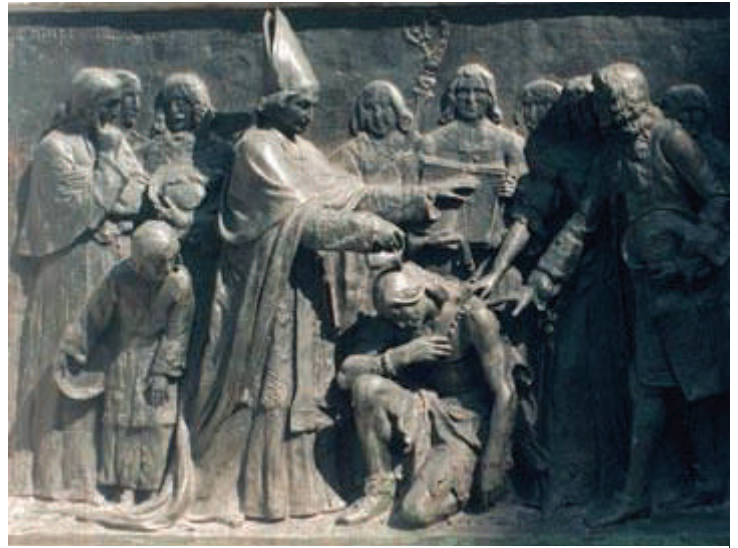
Mgr de Laval baptisant un amérindien.

Il nous faut insister surtout sur sa dévotion à l'Immaculée Conception. C'est sous ce titre qu'il érige, en 1664,