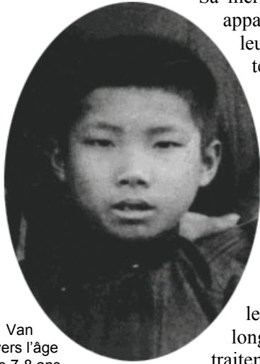
Van vers l'âge de 7-8 ans

Sa mère confie alors cet enfant, apparemment prédestiné, à leur ancien curé, qui a maintenant la charge de l'importante paroisse de Huu Bang, afin qu'il le prépare au service de Dieu. Nous sommes en mai 1935, Van a sept ans.