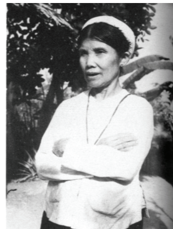
La mère de Van

Après sa confirmation, pendant laquelle il a ressenti un premier attrait pour la vie religieuse, il est envoyé à l'école. Mais il n'en supporte pas le régime sévère. « Je ne puis appeler cette maison une école, mais un camp de concentration pour enfants où l'enseignant n'était qu'un bourreau cruel. Je détestais tant cette école que je n'avais qu'un seul désir : sa destruction ! »