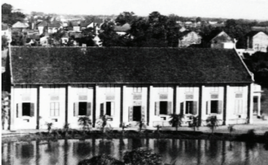
La chapelle des Rédemptoristes à Hanoï