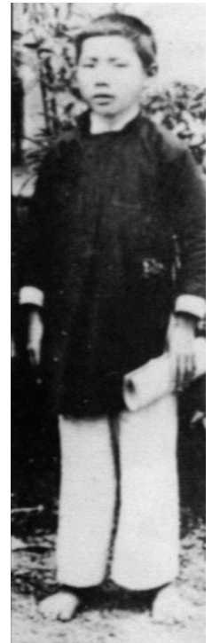
Van vers l'âge de 12 ans

À la haine des méchants qu'il subit encore, il oppose maintenant une par-