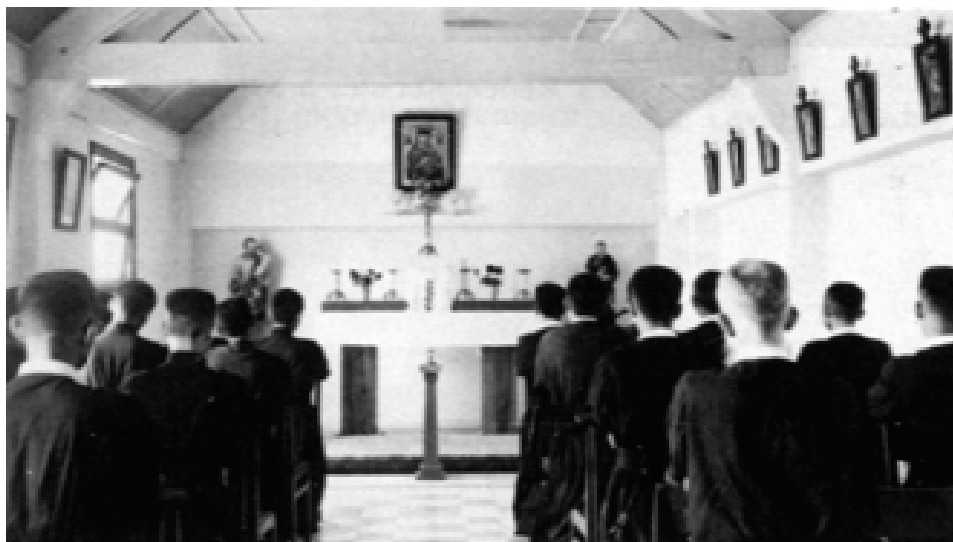
La chapelle du noviciat à Hanoi

Auparavant, sainte Thérèse lui avait fait savoir que leurs entretiens familiers allaient cesser et qu'il aurait à souffrir. Elle l'encouragea : « Reste en paix... Le monde voudra t'écraser, mais tu deviendras une fleur splendide entre les mains de Jésus... Ne cède jamais au découragement... Ne recule