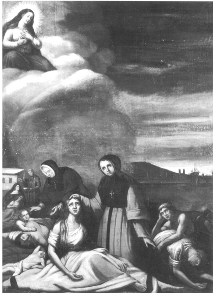
Tableau en ex-voto de Théophile Hamel gardé à l'église Notre-Dame-de-Bon-Secours représentant une Sœur Hospitalière de Saint-Joseph, une Sœur de la Providence et une Sœur Grise soignant les immigrants irlandais victimes du typhus.

Lorsque la grande épidémie de typhus éclate à Montréal en 1847, avec l'arrivée des immigrants irlandais débarqués là sans fortune ni structure d'accueil, dans le plus complet dénuement, Mgr Bourget organise aussitôt les secours nécessaires. Des baraquements sont construits à la hâte sur le terrain voisin du couvent et des sœurs s'y enferment volontairement pour s'occuper pendant plusieurs mois de six cents malades mis en quarantaine... Grâce à cette prompte