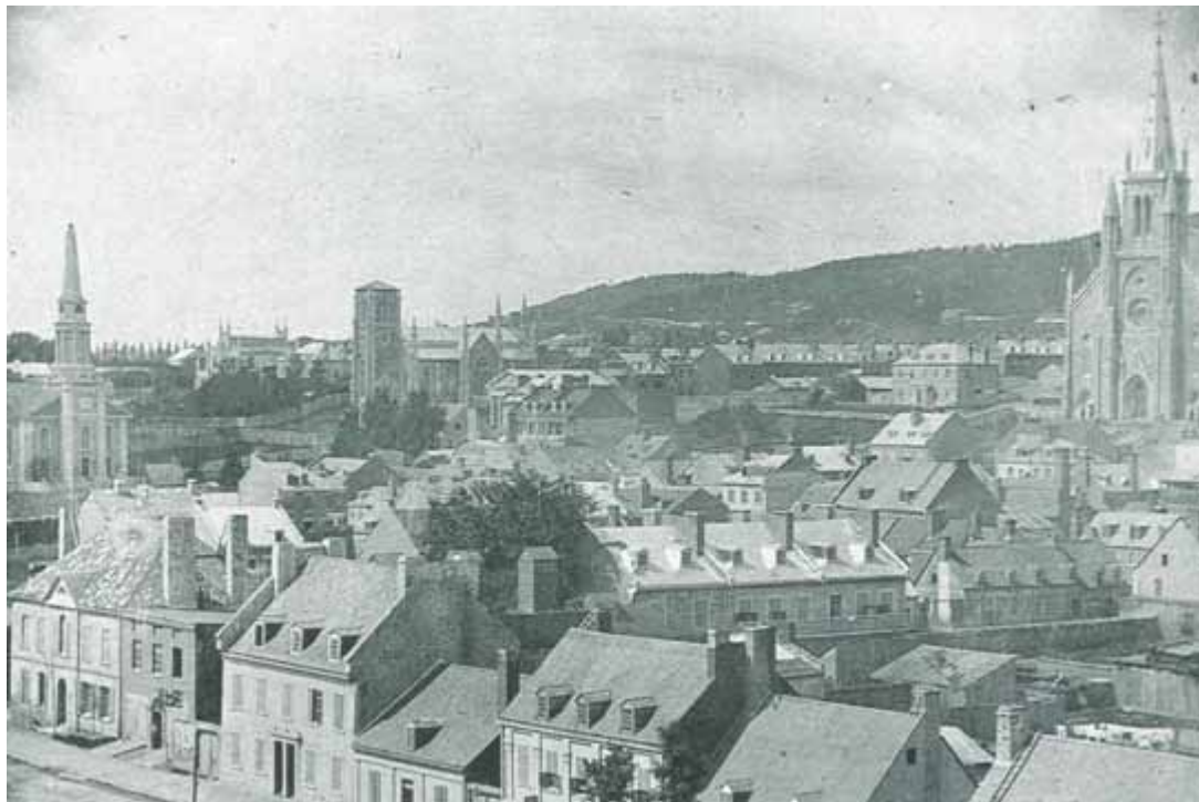
Photographie de 1852, l'une des plus anciennes de Montréal.

conserve avec Pie IX qu'il vénère, la lutte implacable contre le progrès effrayant des idées révolutionnaires, et plus particulièrement contre le libéralisme.