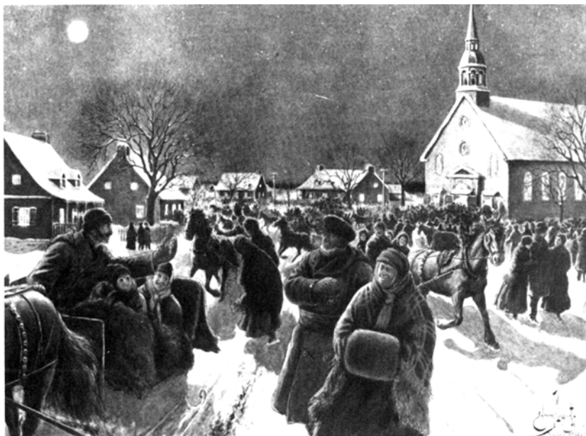
La sortie de messe

La retraite de Mgr de Forbin-Janson connaît aussi de miraculeux succès à Québec et à Trois-Rivières, mais seul, Mgr Bourget va mobiliser toutes les énergies pour entretenir ce retour à la foi et à la pratique, à Montréal.