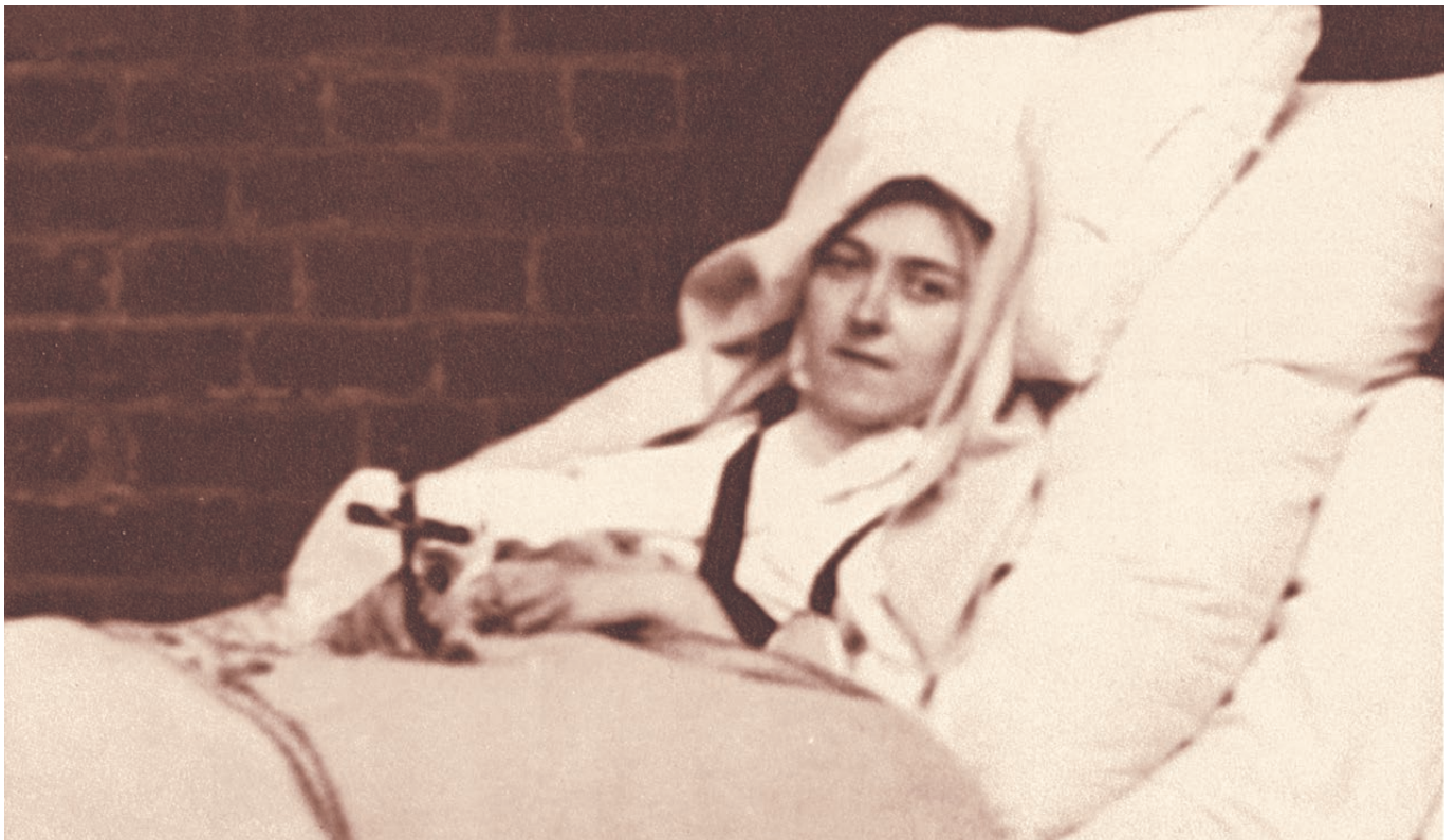
Le 30 août 1897, sur un lit roulant, on sort sainte Thérèse de l'Enfant-Jésus sous le, cloître, jusque devant la porte ouverte du chœur : sa dernière visite au Saint-Sacrement.

« “Elle m'a dit que j'irai à Lisbonne dans un autre hôpital ; que je ne te reverrai plus, ni non plus mes parents ; qu'après avoir beaucoup souffert, je