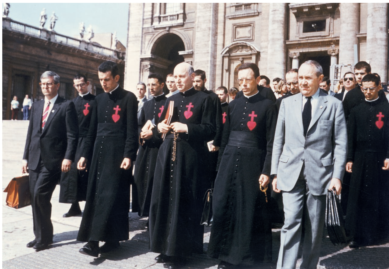
Le 13 mai 1983, l'abbé de Nantes accompagné des frères de sa communauté et de deux cents amis se rendit à Rome pour y déposer un second Livre d'accusation à l'encontre de Sa Sainteté Jean-Paul II.