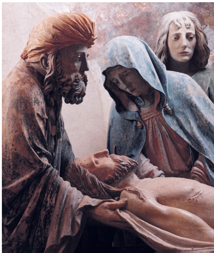
Mise au tombeau du Christ (Chaucource, XVI e siècle).

Ah ! Notre-Dame, votre présence est notre salut, notre paix, notre joie, comme elle fut la nourriture de