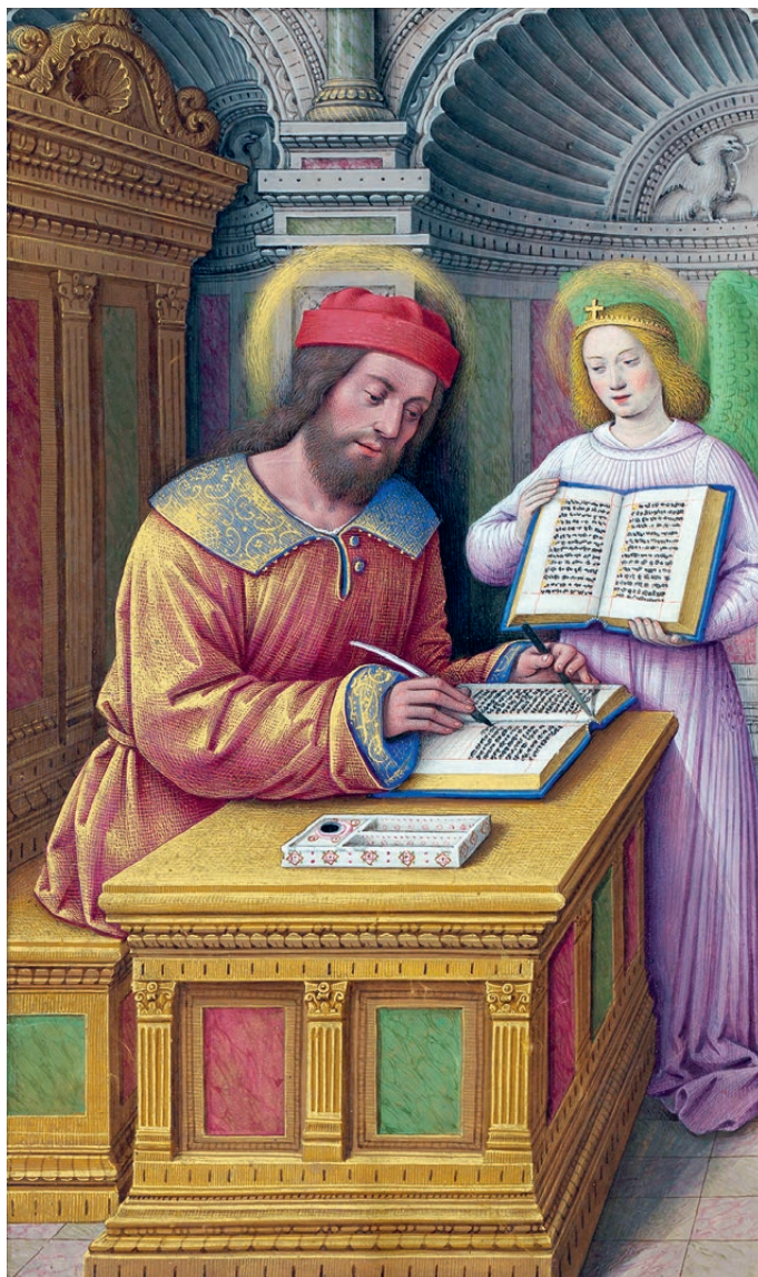
« SAINT MATTHIEU L'ÉVANGÉLISTE. »