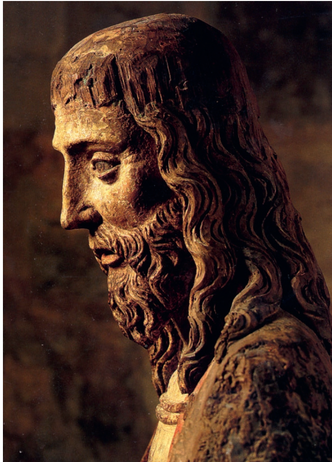
« Christ aux outrages »

Cette révélation est tout à fait nouvelle : Jésus avait annoncé qu'il apportait « aux captifs la délivrance » (Lc 4,18), selon l'oracle d'Isaïe, mais sans autre explication, dans l'Évangile, sur cette libération. Ce verset si important a, de tout temps, été cité par les gnostiques qui prétendent