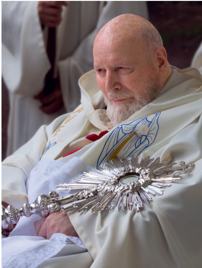
Notre Père à la Fête-Dieu 2009.