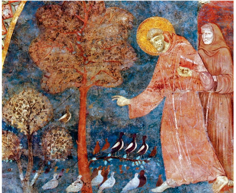
Saint François prêche aux oiseaux (Assise, XIII e siècle).

Essayons, quant à nous, de ressentir un peu de la stupéfaction des témoins du sermon que fit François aux oiseaux, près de Spolète : « François aperçut un bosquet où des oiseaux de toute espèce s'étaient rassemblés par bandes entières. Il y courut aussitôt et les salua comme s'ils avaient été doués de raison. Ils s'arrêtèrent tous pour le regarder. Il s'avança jusqu'au milieu d'eux, leur enjoignit