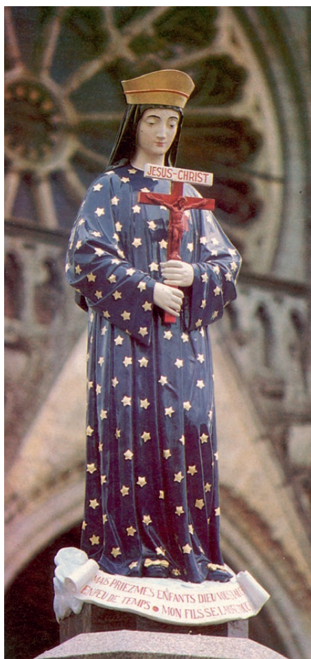
« Mais priez mes enfants ! » Notre-Dame de Pontmain, apparue le 17 janvier 1871 pour sauver la France.

Bien que la situation géopolitique ait connu un profond renversement, l'analyse de notre Père demeure d'une brûlante actualité, d'autant plus que la perspective de la guerre revient dans tous les esprits. Emmanuel Macron, qui a affirmé le 26 février dernier, lors d'une Conférence de soutien à l'Ukraine , que « rien ne devait être exclu pour faire échec à la Russie », ajoutant devant la presse que « l'envoi de troupes occidentales en Ukraine n'était pas à exclure », commet tout à la fois « le crime de vouloir et d'entreprendre la guerre » ainsi que « les folles erreurs et provocations » qui seront suivies de notre défaite.