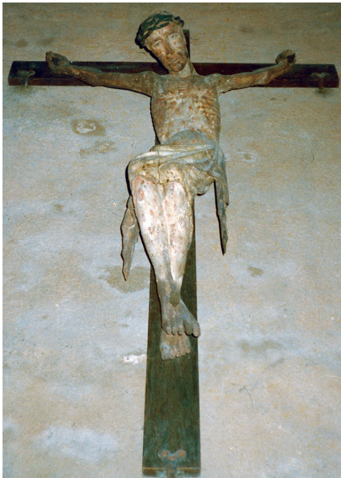
« Mihi autem absit gloriari, nisi in cruce Domini nostri Jesu Christi. »

« Le matin du 14 septembre, il se tenait agenouillé en prière devant sa cellule. Le jour n'avait pas commencé à poindre, mais le saint, dans l'attente de l'aube, le visage tourné vers l'orient, priait, avec les mains levées et les bras étendus : « Mon Seigneur Jésus-Christ, je te prie de m'accorder deux grâces avant que je meure : la première est que, durant ma vie, je sente dans mon âme et dans mon corps, autant qu'il est possible, cette douleur que toi, ô doux Jésus, tu as endurée à l'heure de ta très cruelle Passion ; la seconde est que je sente