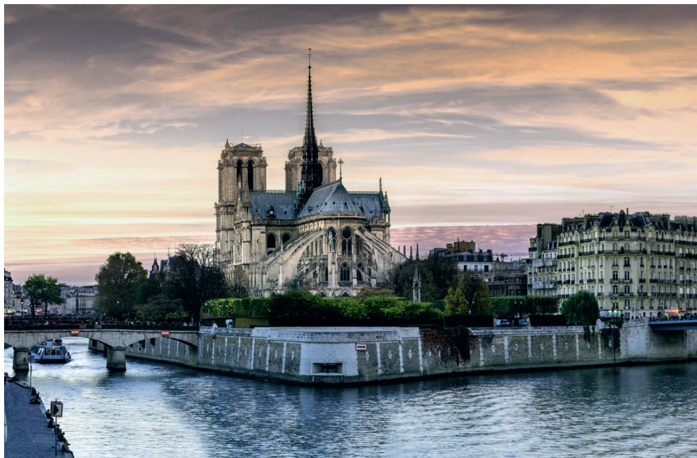
« La cité de Paris, consacrée à l'illustre Marie, brille en l'honneur de cette Vierge. » (SIÈGE DE PARIS PAR LES NORMANDS, par Abbon, IX e siècle)

Dans son allocution, saint Pie X reprit les mots du pape Grégoire IX à Saint Louis : « Dieu, auquel obéissent les légions célestes, ayant établi ici-bas des royaumes différents suivant la diversité des langues et des climats, a conféré à un grand nombre de gouvernements des missions spéciales pour l'accomplissement de ses desseins. Et comme autrefois il préféra la tribu de Juda à celles des autres fils de Jacob, et comme il la gratifia de bénédictions spéciales, ainsi il choisit la France de préférence à toutes les autres nations de la terre pour la protection de la foi catholique et pour la défense de la liberté de l'Église. Pour ce motif,