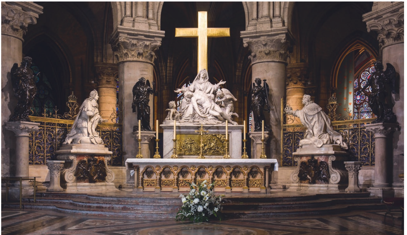
Le groupe sculpté commémorant le Vœu de Louis XIII, dans le chœur de la cathédrale Notre-Dame de Paris.