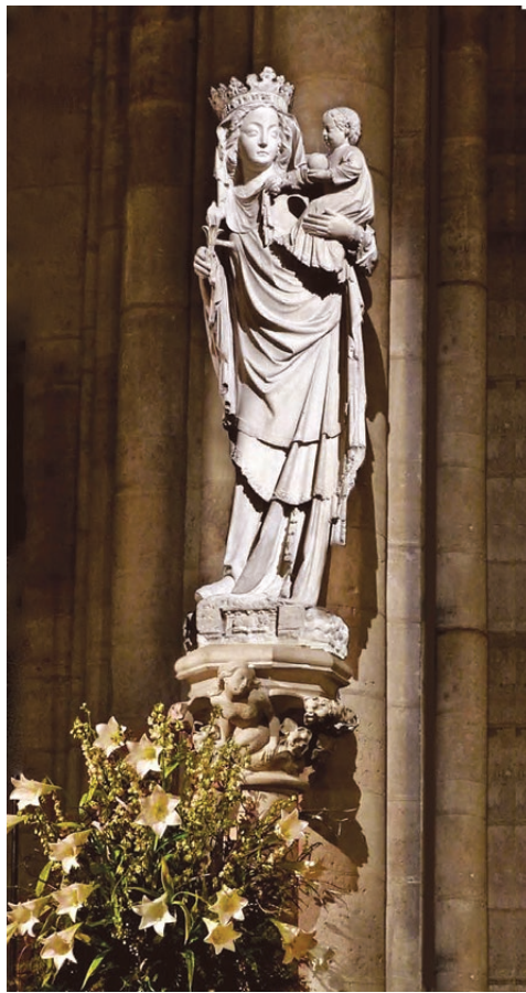
La Vierge du pilier de Notre-Dame de Paris (statue du quatorzième siècle).

C'est qu'au quatorzième siècle, et encore plus au quinzième, il y avait grande pitié au Royaume de France qui fut plusieurs fois sur le point d'être anéanti. En 1431, c'est à Notre-Dame de Paris que le petit Henri VI de Lancastre fut sacré roi de France. Roi de France et d'Angleterre !