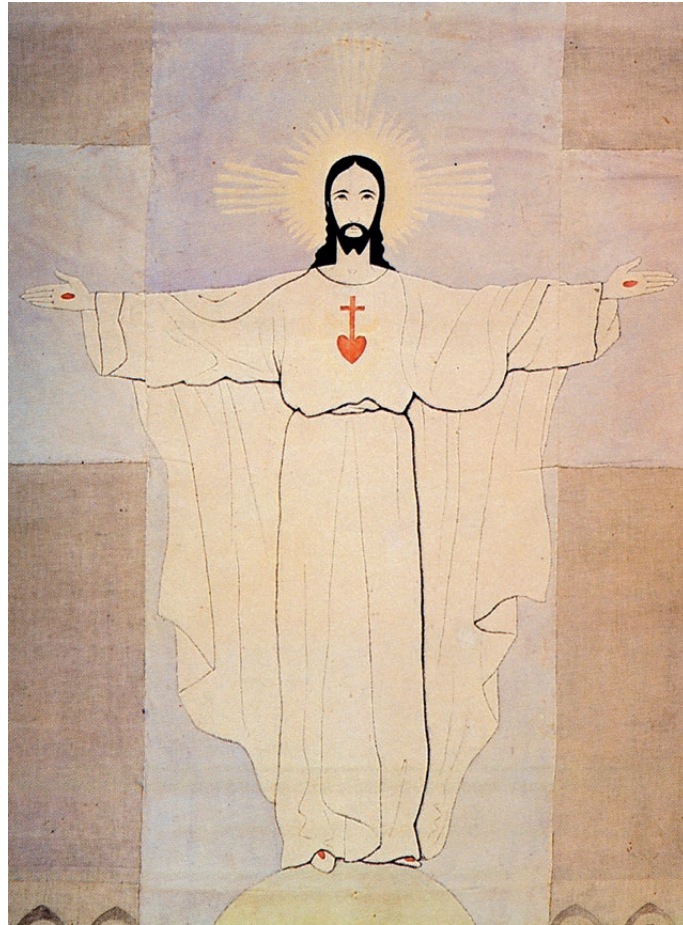
Sacré-Cœur peint sur tissu par saint Charles de Foucauld pour décorer sa chapelle.

musulmans avachis. Mais avec des croyants ardemment soumis à l'Esprit qui parle et agit en chaque religion selon un appareil dogmatique et disciplinaire particulier, dont la totalité doit être sauvegardée.