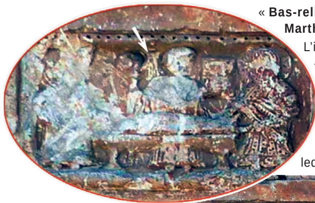
« Bas-relief incrusté dans le portail latéral de la basilique Sainte-Marthe de Tarascon.