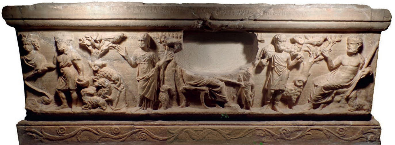
Le sarcophage de l'ancien prieuré de la Gayole (II e - III e siècle).