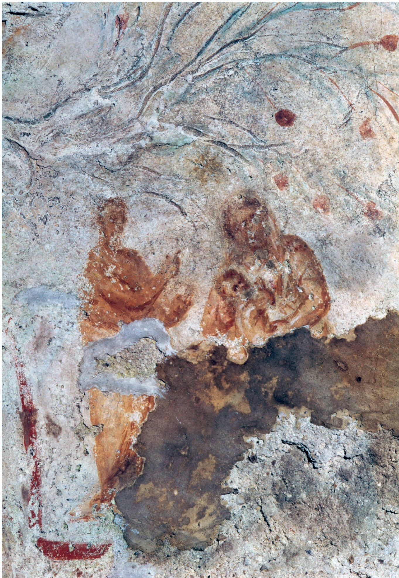
La plus ancienne représentation de la Sainte Vierge (II e - III e siècle) est une fresque découverte dans les catacombes de Priscille, à Rome.