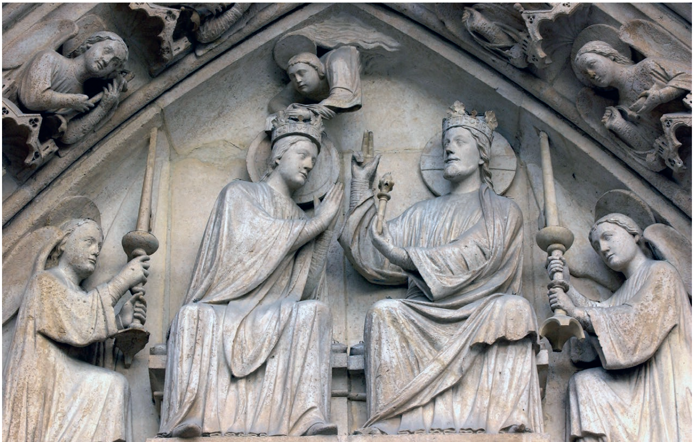
Tympan du portail du couronnement de la Vierge, vers 1210.