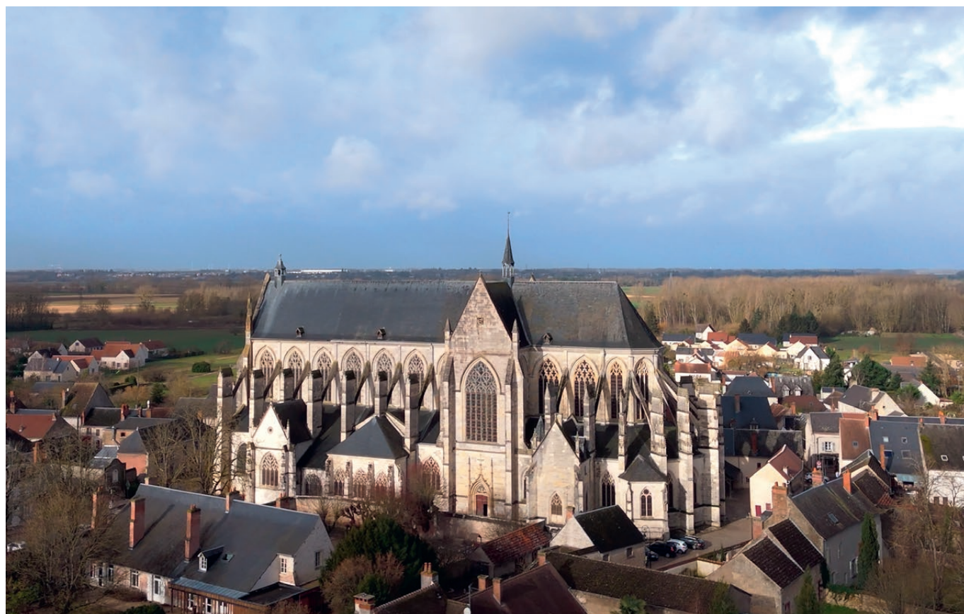
Basilique Notre-Dame de Cléry, Orléanais, quinzième siècle.

Le roi Philippe le Bel , Philippe le Catholique, attribua à Notre-Dame de Cléry ses succès en Gascogne et en Flandre. Il lui offrit une cloche, qui passait pour la plus belle du royaume. Il aurait voulu aussi lui bâtir une église digne d'elle, magnifique, mais il mourut sans avoir pu réaliser son désir, qu'il légua néanmoins à ses successeurs, avec sa dévotion : à ses trois fils, d'abord, puis à leurs cousins Valois. C'est Philippe VI de Valois qui posa la première pierre de la nouvelle église, en 1339. Dans ce délicat changement de dynastie, la dévotion à Notre-Dame de Cléry favorisa donc la continuité monarchique.