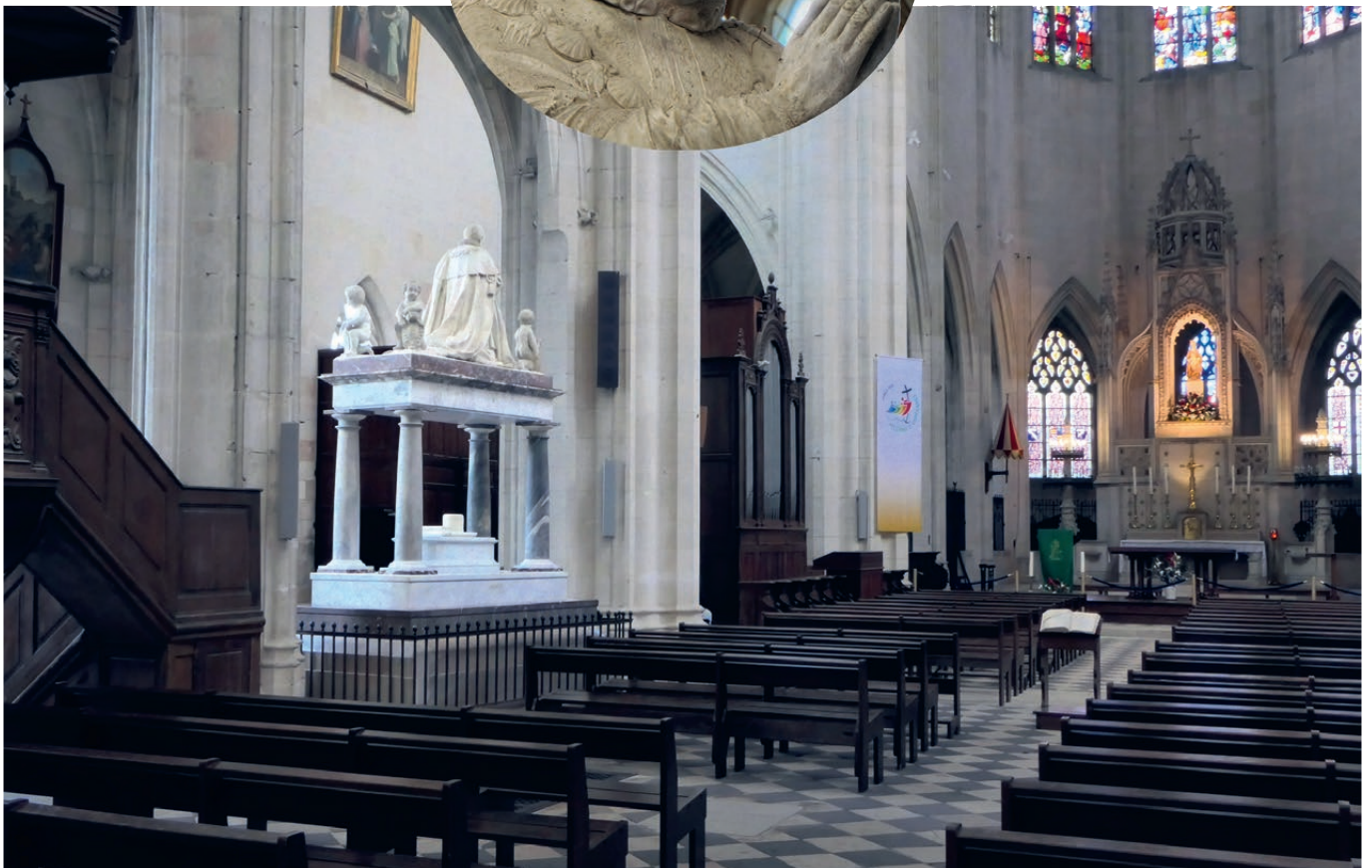
LA BASILIQUE DE NOTRE-DAME DE CLÉRY : la statue miraculeuse de la Vierge à l'Enfant, au-dessus du maître-autel et le monument funéraire de Louis XI (par Michel BOURDIN, en 1622).