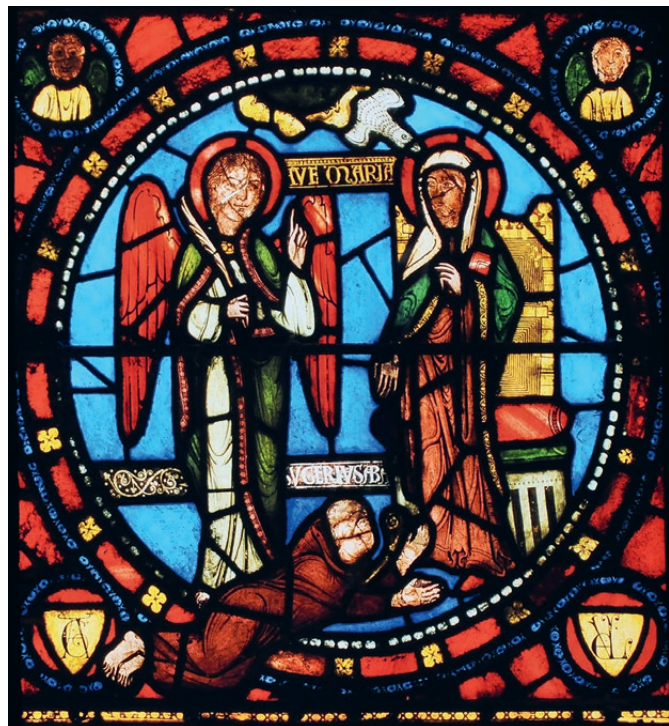
Figure ci-contre : L'abbé Suger prosterné aux pieds de la Sainte Vierge, vitrail de l'abbaye de Saint-Denis, dont il a lui-même dirigé la construction. Compagnon de Louis VI depuis l'enfance, converti par saint Bernard à une stricte observance de l'austérité monastique, il fut le plus influent ministre de la cour de France dans cette première moitié du douzième siècle. Régent du Royaume pendant la deuxième Croisade, Louis VII l'appela « Le Père de la Patrie ».

s'est fait, mais selon les historiens de l'art, en cette seconde moitié du douzième siècle, les fleurs de lys d'or comme le fond d'azur évoquaient la Vierge Marie, « lys fleuri parmi les épines » (Ct 2,2). C'est certainement Louis VII, dans les circonstances tragiques de son règne, qui a voulu ainsi placer le Royaume sous la protection de Notre-Dame.