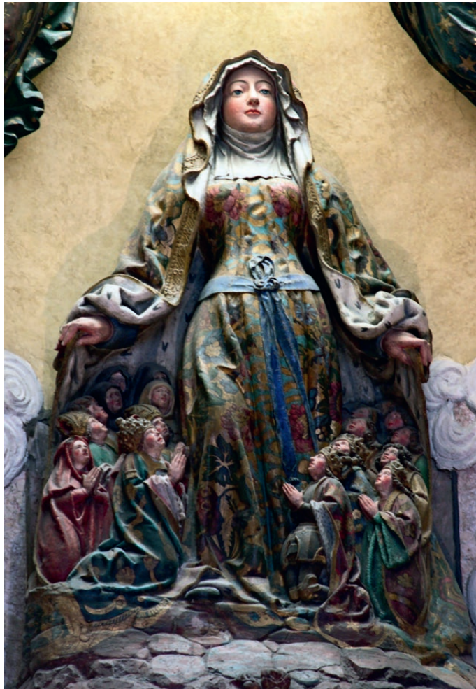
« La Vierge de Miséricorde »

Or, Jeanne avait affirmé à ses juges que la Couronne de France, que saint Michel lui avait montrée à Chinon, ainsi qu'au Dauphin et à la Cour, durerait « mille ans et plus ».