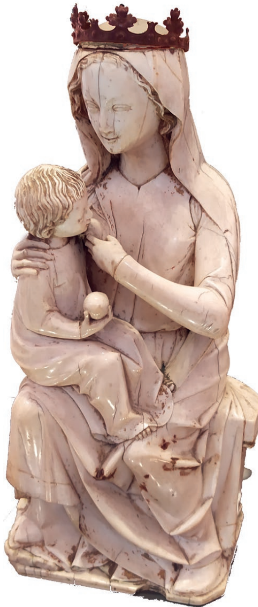
Vierge assise allaitant l'Enfant Jésus.

« Les grands du royaume, vassaux épris de liberté, voulant lever l'impôt et faire justice par eux-mêmes